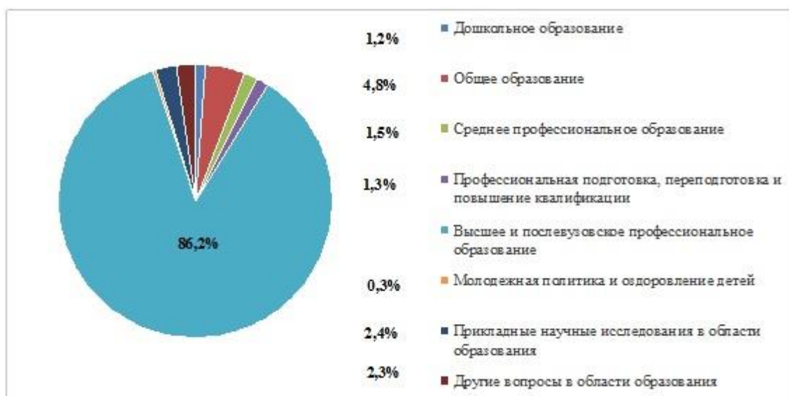
Рис. 2. Структура расходов на образование в РФ за 2016 год

Рассмотрим структуру финансирования образования в федеральном бюджете.