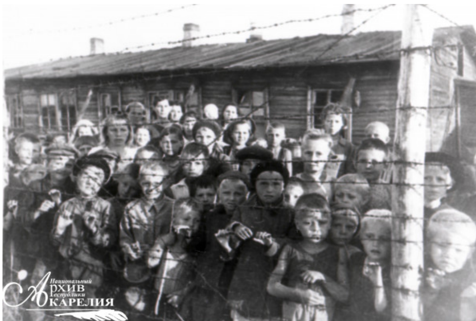
Рис. 2. Дети города Петрозаводска в период оккупации, находившиеся в концентрационном лагере. Петрозаводск, 1944 г. Репродукция с фотографии Г.З. Санько 19