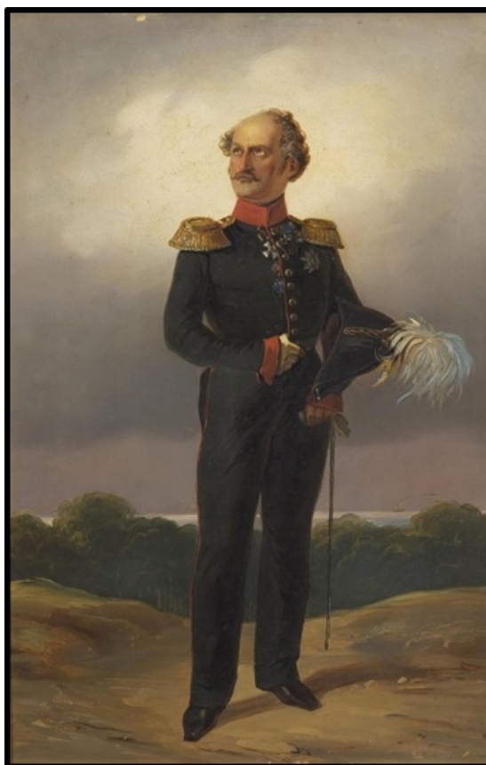
Рис. 2. Б. Виллевалде. Портрет Л.И. Зедделера 13

Несмотря на признанный вклад Л.И. Зедделера в отечественную науку и военно-энциклопедическую литературу, его биография по-прежнему остается малоисследованной. В ней достаточно неосвещенных сюжетов, которые сейчас возможно восполнить только по архивным материалам. В частности, интерес представляет выяснение точной даты рождения Л.И. Зедделера, поскольку во многих источниках указывается, что Логгин Иванович родился в 1791 году (в «Русском биографическом словаре» 7 или «Военной энциклопедии» под редакцией В.Ф. Новицкого 8 ). Однако по данным выписки из метрической книги, хранящейся в Российском государственном историческом архиве, дата рождения вдохновителя первой полноценной российской военной энциклопедии – 1790 год. Вероятно, составители биографии Л.И. Зедделера в этих трудах пользовались одним источником, который содержал ошибку и не подвергали критике заимствованную информацию 9 .