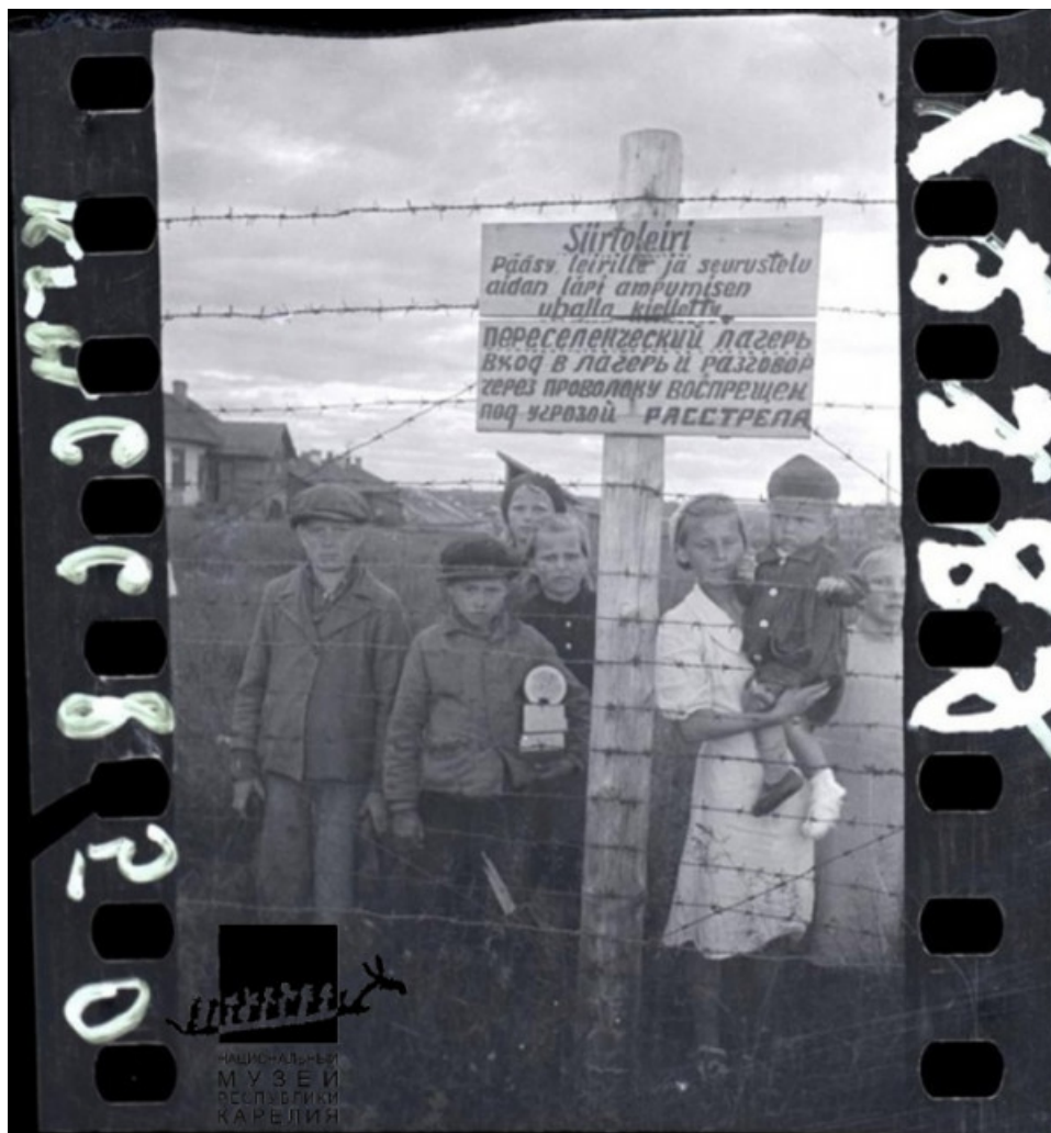
Рис. 1. Объявление на ограждении концентрационного лагеря № 6 в районе Куковка в г. Петрозаводске. 1944 год. 27

Жителей Ленинградской области депортировали и заключали не только в концентрационные лагеря. Небольшая часть проживало относительно свободно в городе Петрозаводске. На 1 января 1944 года в горде проживало 1452 переселенца-ненационала 28 .