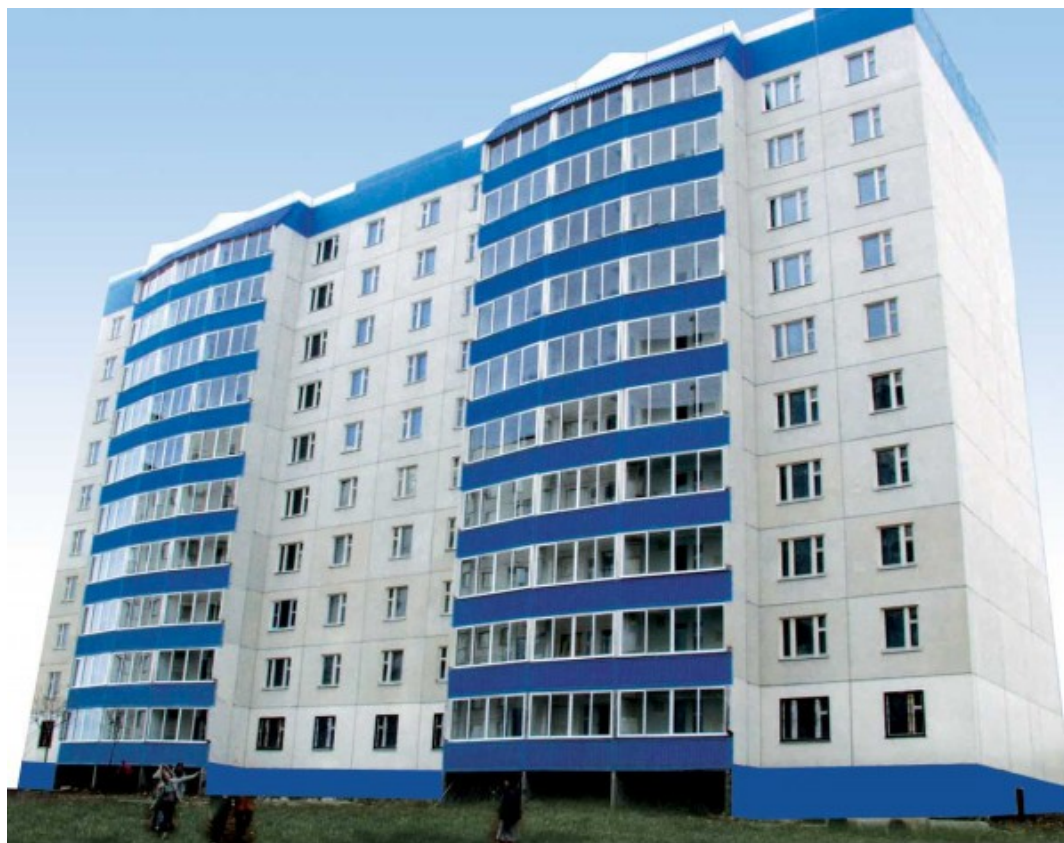
Рисунок 2 [4] - Панельное строительство