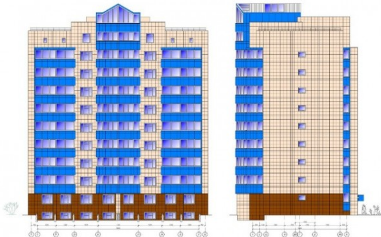
Рисунок 1[3]- Железобетонное строительство с вентилируемым фасадом

Строительство многоквартирного жилого дома на сегодняшний день является главным вариантом решения проблемы для застройщиков. Преимуществом технологии является заселение в дом нескольких семей, если возведение здания ведется на небольшом участке земли. Наружная отделка жилого дома должна обеспечить привлекательность фасада, а так же дополнительное утепление. Исключением из правил не были фасады многоквартирных домов. На рисунках 1,2,3 представлены рассматриваемые дома, которые имеют различный внешний вид.