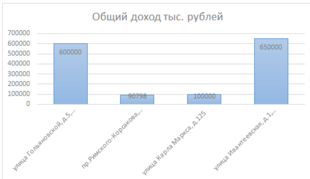
Рисунок 3. Общий доход

Из графиков видно, что при увеличении общего дохода проекта, его доходность снижается. Однако из-за больших инвестиций прибыль более затратных проектов высока, несмотря на маленький процент доходности.